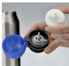
Leicht zu reinigen